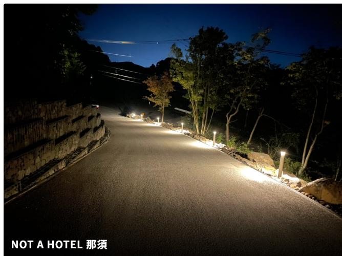
NOT A HOTEL 那須