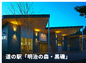
道の駅「明治の森・黒磯」