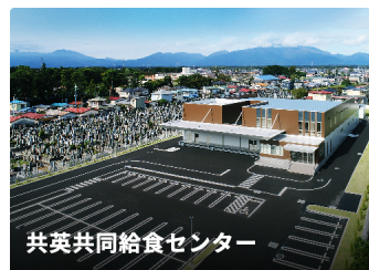
共英共同給食センター